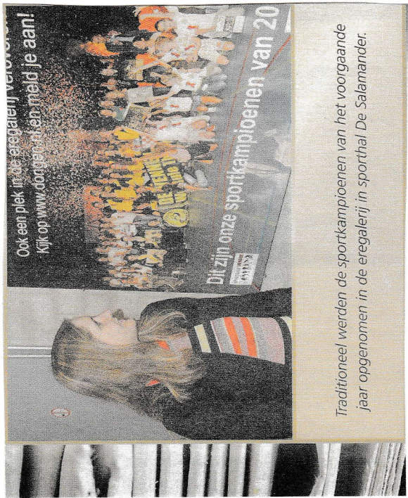
Traditioneel werden de sportkampioenen van het voorgaande jaar opgenomen in de eregalerij in sporthal De Salamander.